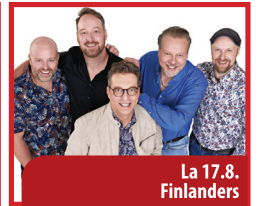
La 17.8. Finlanders