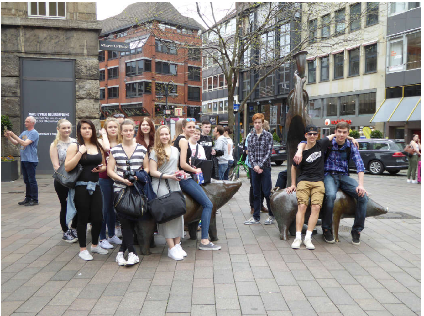
Opintomatka Saksaan Bremeniin