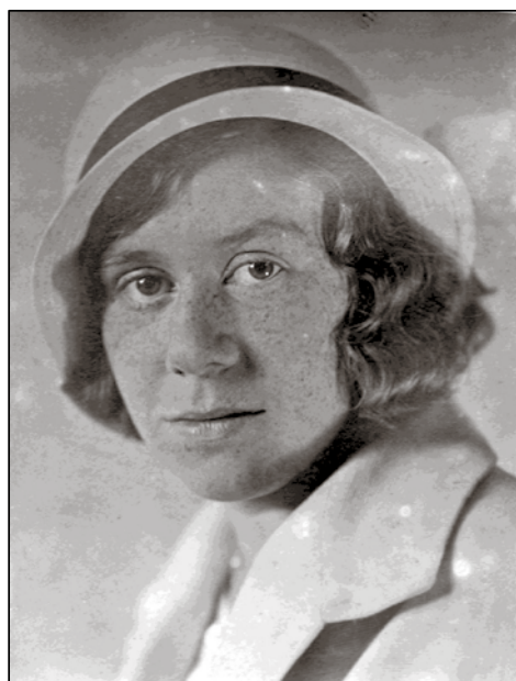
Saima Harmaja (8.5.1913–21.4.1937)